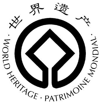
中國世界遺產標誌

世界遺產青年保衛者形象——“帕特里莫尼托”(Patrimonito)誕生在挪威卑爾根舉辦的第一次世界遺產青年論壇上。當時，一些講西班牙語的學生根據世界遺產標誌，創造了一個他們可以辨認的人物形象。“帕特里莫尼托”(Patrimonito)在西班牙語意為“小遺產”，這個人物形象代表着世界遺產青年保衛者。