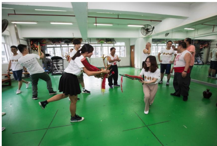
同學們試演舞醉龍

大鵬展翅地張開，像對角線那樣一高一低；而單腿獨立，則像神仙飛天一樣。龍頭和龍尾互相呼應，舞姿可以自由發揮，讓整個醉龍的動態變的更豐富、更具生命力。