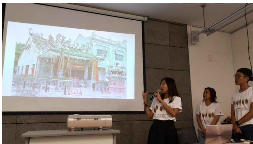
同學們分享世界各地的歷史建築保護經驗

同學們一起探討和分享了世界各地的歷史建築保護經驗。看到每個案例的起因、過程和各項影響因素，再參照現狀去思考分析澳門城市歷史建築的未來路向。首先導師分享了香港古蹟的活化實例，如前荔枝角醫院變身為饒宗頤文化館、雷生春（具古典意大利建築特色的唐樓）活化成香港浸會大學中醫藥保健中心及藍屋建築群等。其後同學們各自分享世界各地不同的活化實例，如馬來西亞檳城、佛山嶺南天地、北京 798 藝術區、巴塞隆那聖卡特那市場、台北大稻埕迪化街等。