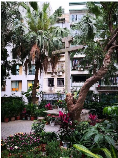
聖老楞助堂的石製十字架， 證明它是澳門三大古老教堂之一

聖老楞佐堂作為風順堂區的中心教堂，早在 1560 年已經建成。這庭屹立在山峰上面臨著“大海灣”的西方寺廟有著保佑航海人員的意味，因為感覺和媽祖廟有異曲同工之妙，所以又稱“風順堂”及“海神廟”。這座教堂在 19 世紀 80 年代進行改建，成為了新古典主義的新式教堂。改建後的教堂表面採用了許多裝飾用柱，把整座建築變成一座大型雕刻品。這種柱子是愛奧尼柱式，予人感覺比較陰柔，故有“女性柱”的別稱。在教堂旁邊有一座由明代已經佇立的石製十字架，底座刻著“INRI 1627 e 1811”字樣，是澳門地區早期由教會分區的指標。這一分區主要在歐洲中世紀晚期確立，因為教堂與歐洲居民的生活息息相關，具有社區會堂的功能，所以分區是以居民前往的教堂來區分，澳門一直沿用至今。