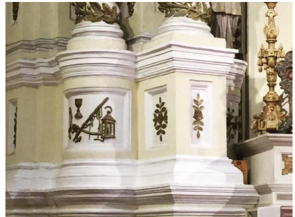
聖爵、皮鞭等工具說明耶穌受苦受難的過程