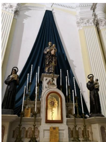
聖方濟各聖觸的存放位置

之後我們到了有“三巴仔”之稱的聖若瑟修院教堂，為甚麼會被叫作“三巴仔”呢？首先我們要了解“三巴”是甚麼，“三巴”這個名字是來自於“聖保祿”的葡萄牙文（São Paulo），由於大三巴牌坊是指聖保祿大教堂遺址，而街坊看到這規模較細的而稱“三巴仔”。聖若瑟修院是澳門第二所培訓遠東傳教人士的高等教育機構，對澳門以致遠東教會有著積極貢獻。不得不說這座教堂裡最珍貴的就是收藏了聖方濟各·沙勿略的臂骨，作為傳播天主教東方教會的耶穌會士先導者，沙勿略在葡萄牙的邀請下先後到了馬六甲和日本傳教，因為在日本傳教受到挫折，了解到中國文化對日本的影響而萌生了到中國傳教的念頭。1552 年由於明朝的鎖國政策只能登上遙望台山上川島，不久後病逝，終未能達成到中國傳教之心願。最終在耶穌會士的努力下，在 1582 年利瑪竇成功踏足中國大陸。為紀念方濟各的努力，教會把方濟各的聖觸安放在路環聖方濟各教堂，後來才轉到修院教堂。