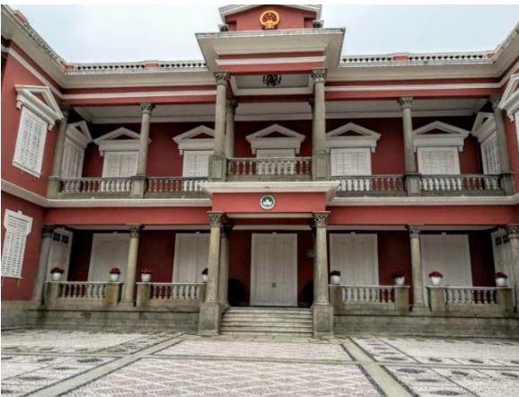
澳門政府總部及特色柱頭

澳門政府總部成為澳葡政府總督府時，是一位清代子爵的別墅，座落於當時還是一個沙灘的南灣之上。事實上從今時今日的南灣大馬路到民國馬路當時也是澳門一個大海灣，澳門島當時只有 2.78 平方公里，而今天已發展成約 11 平方公里的半島。到了 19 世紀，在南灣到西灣一帶修築了海堤才逐漸結束了海灣地形，現時這條海堤是澳門最長的一個文物，雖然它不太起眼，但卻是風順堂街坊的回憶，是見證這裡由沙灘變成馬路的物證。而風順堂區作為澳葡政府早期的中心地帶，自然也為這一個社區留下很多生活色彩。1881 年這間子爵大宅遭受拍賣，到了 1888 年正式成為了澳葡政府的總督府。這間用色浪漫而儒雅，處處體現出葡萄牙民族特色（包容、共融）的建築物和其他政府重要機關一樣被塗成粉紅色，配大量綠色的植物與水池更顯得令人愉悅。