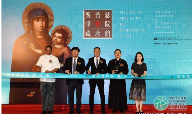
文化局牽頭合作成立藏珍館 3

最後吳先生帶我們到教堂的藏珍館進行導賞。修院內收藏不少典籍、油畫、聖人雕像、祭祀用品等宗教文物。2016年文化局與聖若瑟修院及天主教澳門教區共同設立、“藏珍館”展示部分珍貴文物，讓居民及旅客了解修院對東方教會的貢獻，及澳門中西文化交流史。