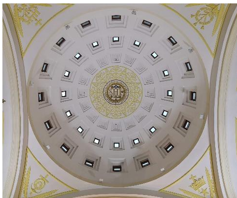
教堂內部的穹頂設計