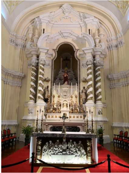
聖若瑟修院教堂的主祭壇