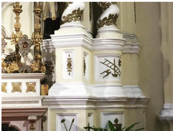
木匠的工具說明了聖若瑟的身份

在講解完關於教堂的故事和建築後，吳先生讓我們去尋找教堂內的一些符號，才發現小小的教堂裡，竟然蘊藏了大量的符號信息。這些信息不用文字記錄出來是為了讓世界不同語言的人都能解讀和了解，揭示了早期天主教會把握了對言語溝通困難時傳教方法。最顯然見的是主祭壇周邊有關耶穌受苦受難的故事、而左祭壇則是講鮮聖若瑟的身份，特別是那個開了百合花的木杖，便是屬於他的符號。期待大家到聖若若瑟修院發掘更多有趣的符號及故事。