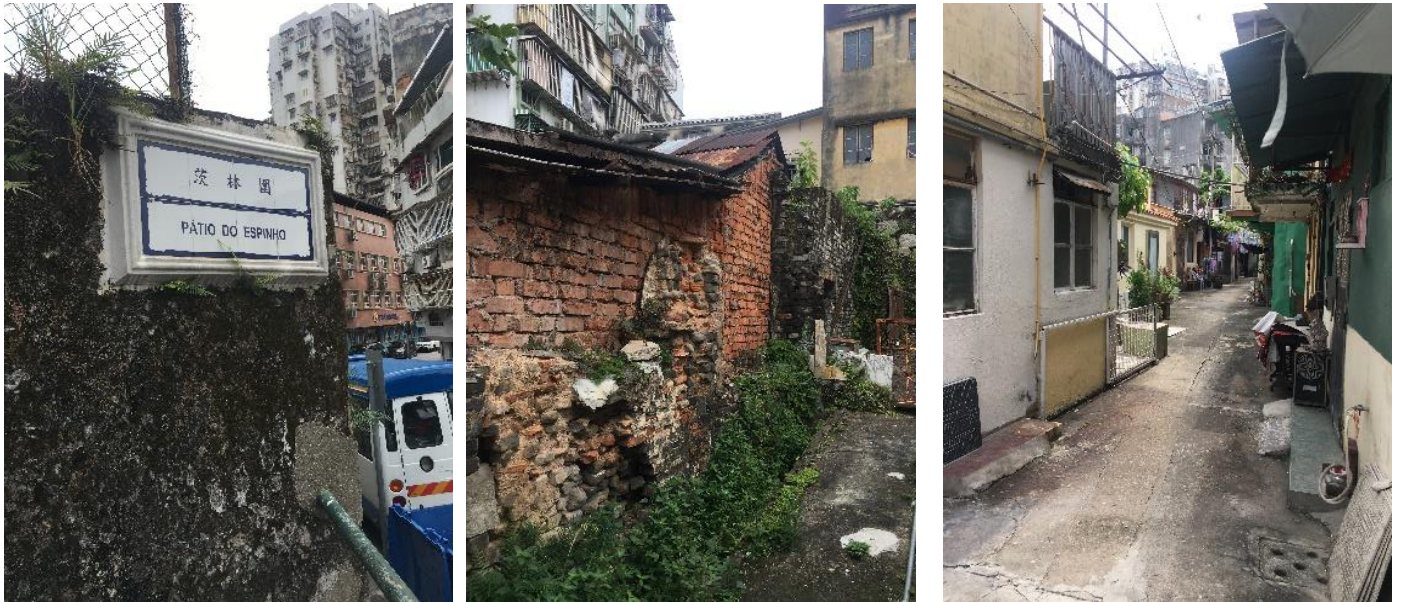
夯土牆（沿新勝街伸延至梁永興村）