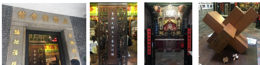
魯班先師木工藝陳列館位於庇山耶街39至41號之間的上架行會館內

現魯班先師大殿內展示了一個大型魯班鎖，一旁的陳列室內則透過一系列的展覽和多媒體設施，展示包括鋸、刨、鑽、墨斗等80多件傳統木工具，介紹魯班傳說與發明之故事以及工具使用方法，陳列以卯榫結合製作的建築構件、以及供訪客試用的木工具，充分展現前人的巧手工藝和傳統智慧，同時增進訪客對木工藝和傳統行業的認識。