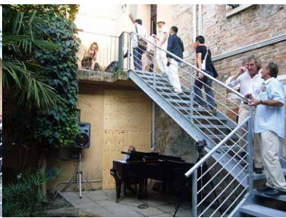
花園通往一樓的展場