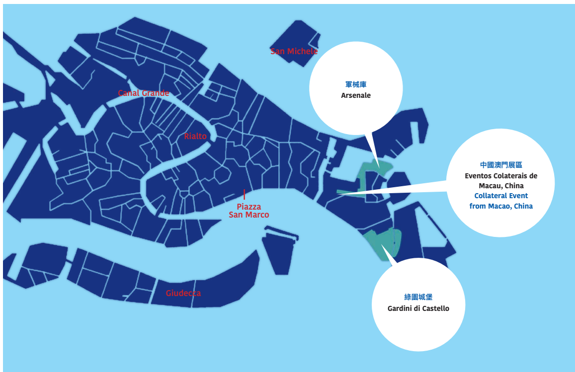
Localização e Mapa