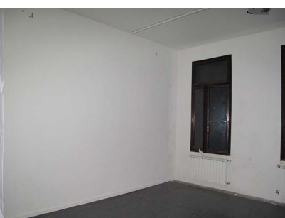
Área de Exposição C (Nota: As janelas estão seladas.)