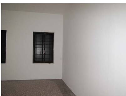
Área de Exposição D (Nota: As janelas estão seladas.)