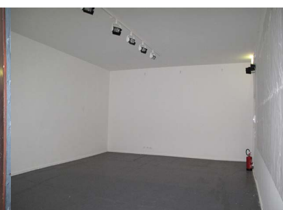
Área de Exposição B