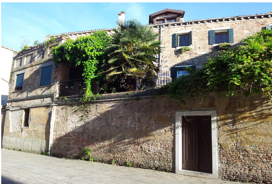
Exterior do local da exposição