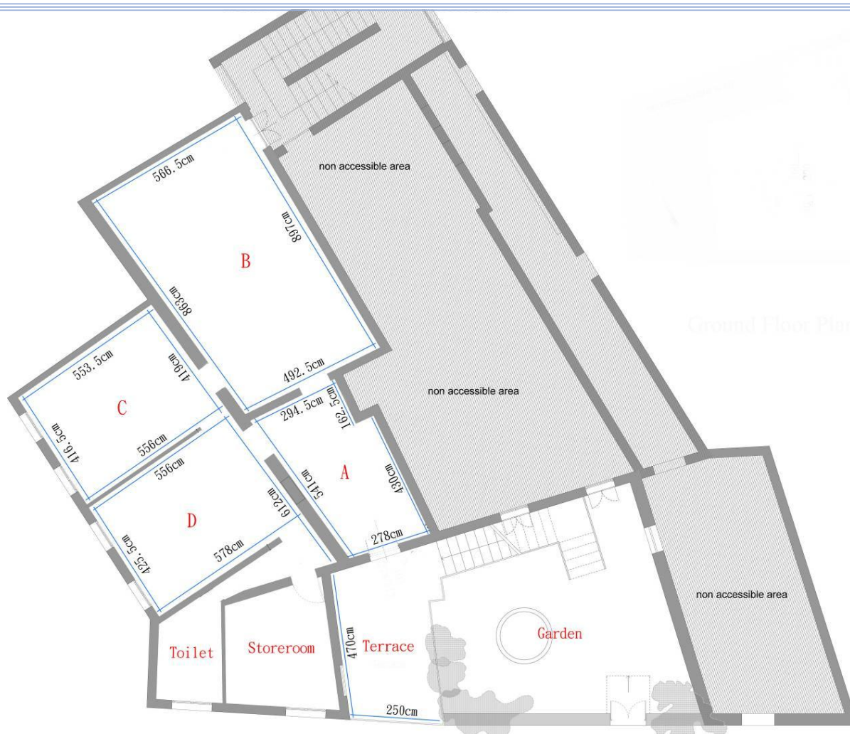
Planta baixa do local da exposição

Nota: Altura de pé direito: cerca de 3,65 metros; altura e largura da porta: cerca de 2 x 1 metros.