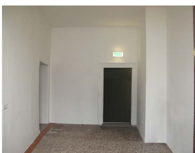
Área de Exposição A