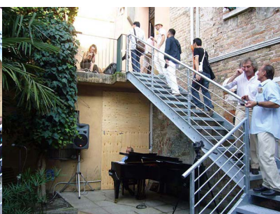
O jardim comunica com as áreas de exposição no 1º andar